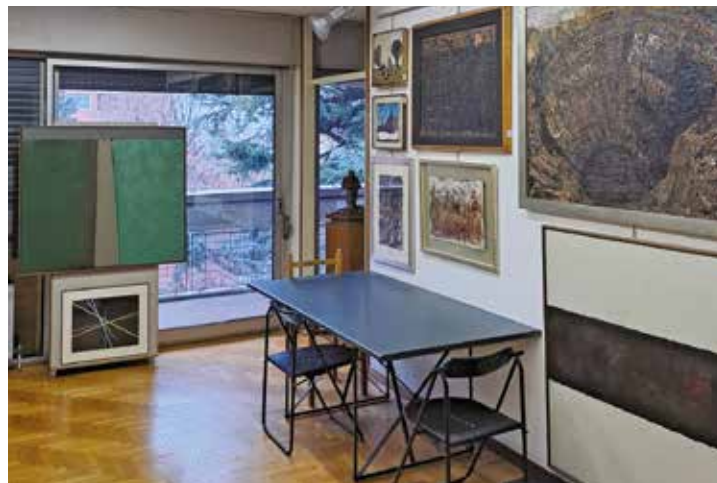
La sede della Fondazione Congdon a Buccinasco

Tutelando l'opera figurativa e letteraria di Congdon, la Fondazione contribuisce alla conoscenza del processo creativo dell'artista, approfondendone le componenti etiche e religiose. La William G. Congdon Foundation individua nella pratica artistica – e nell'attività di riflessione filosofica, storica e critica che essa stimola – un momento essenziale della nostra umanità, del desiderio di dare un senso alla realtà, alla propria esperienza, alle proprie tensioni.