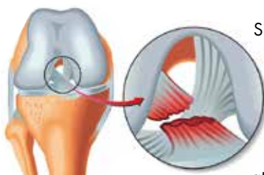
Rottura legamento crociato anteriore (LCA)

La lesione di un certo numero delle fibre del legamento crociato anteriore potrebbe comportare una instabilità residua dell'articolazione del ginocchio, e pertanto si renderebbe necessaria una ricostruzione chirurgica del legamento in artroscopia, al fine di rendere nuovamente stabile l'articolazione. per quanto riguarda la lesione osteocondrale e' sicuramente indicata una artroscopia di ginocchio per evitare che un frammento di cartilagine si stacchi dentro l'articolazione determinando un blocco articolare.